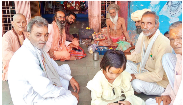
हरिभूमि न्यूज ▶▶ राजगढ़

एनएच-3 पर पचोर के समीप शनिवार तड़के देहरा जोड़ पर बने ओवर ब्रिज के पास के डिवाइडर से बोलरो वाहन टकरा गया। हादसे में 1 व्यक्ति की मौके पर ही मृत्यु हो गई वहीं दूसरे ने राजगढ़ जिला चिकित्सालय में इलाज के दौरान दम तोड़ दिया। हादसे में घायल अन्य लोगों का इलाज जिला अस्पताल में जारी है वहीं 2 घायलों को भोपाल रेफर किया गया है।