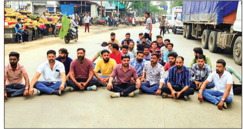
हरिभूमि न्यूज़ ► देवास

करणी सेना के सैकड़ों कार्यकर्ताओं ने जिले भर में रास्ता रोककर प्रदर्शन किया इंदौर-भोपाल हाईवे पर भी लगभग एक घंटे तक चक्का जाम किया।