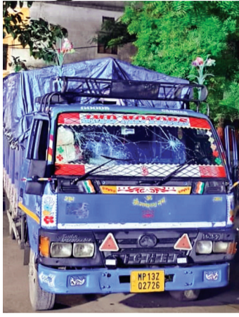
हरिभूमि न्यूज ▶▶ ब्यावरा/तलेन

जिले में गौवंश तस्करो पर लगातार लगे जाने की दिशा में पुलिस की कार्रवाई भी नाकाफी नजर आ रही है। सारंगपुर में गौवंश तस्करी में मौत की बात हो या फिर पचोर-सारंगपुर में मेवात ढाबे पर वीफ मिलने की। इन घटनाओं के बाद भी तस्करो को पुलिस का भय दिखाई नहीं दे रहा, बल्कि उनका काम