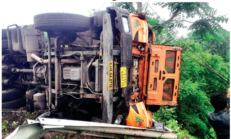
हरिभूमि न्यूज ▶▶ राजगढ़

एनएच-52 पर नेवज नदी के बड़े पुल के समीप एक पखवाड़े में दूसरा हादसा हुआ है। शनिवार दोपहर नसीराबाद से माल भरकर रायपुर जा रहा