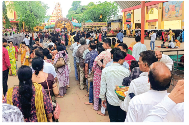
नलखेड़ा